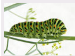
Kein Leckerbissen für Vögel ist nach dem Genuss von Giftpflanzen die Raupe des Schwalbenschwanzes.

Auf dem Hof Wessels tauchte die Raupe des sonst in der hiesigen Umgebung nicht mehr vorkommenden Falters auf. Der Biogarten und der warme Sommer sorgten für die Wiederkehr des prächtigen Schmetterlings